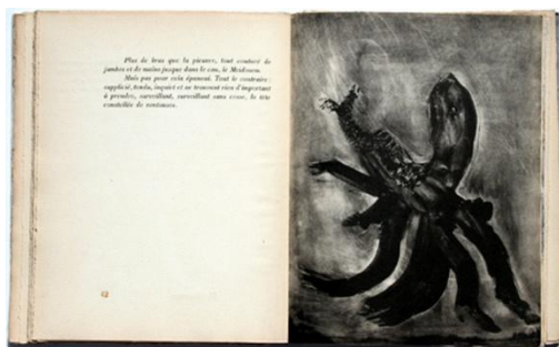
H. Michaux, « Portrait des meidosems » in Œuvres complètes