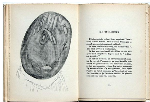
H. Michaux, « Entre centre et absence », in Plume , © Editions Gallimard

Le plus souvent auteur et artiste, il a aussi écrit en parallèle à des estampes d'autres artistes ou inversement accompagné de gravures les textes d'un autre auteur. Henri Michaux a beaucoup expérimenté dans le domaine de la connivence entre texte et images.