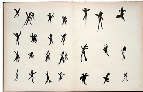
H. Michaux, Mouvements , © Editions Gallimard

Henri Michaux, souvent restreint à sa dimension d'écrivain ou d'artiste, nous incite, dans ses propres livres, à dépasser ce clivage. Tout au long de son œuvre il a confronté écriture et images selon des modalités très variées : réflexions en marge de la peinture ( Peintures et dessins ), commentaires poétiques d'images ( Peintures, Lecture de huit lithographies de Zao Wou-Ki... ), dialogue entre texte et images ( Arbre des tropiques, Exorcismes, Entre Centre et absence, Labyrinthes, Vigies sur cible, Hors de la colline... ), recueil de planches accompagnées d'un poème ( Mouvements, Droites libérées, Par la voie des rythmes, Saisir, Par des traits... ) ou encore témoignages écrits et graphiques sur l'expérience de la drogue ( Misérable miracle, L'Infini turbulent, Paix dans les brisements, Vents et poussières... ).